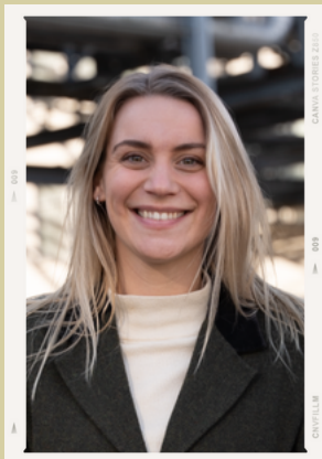
Sanne Marketing & Communicatie